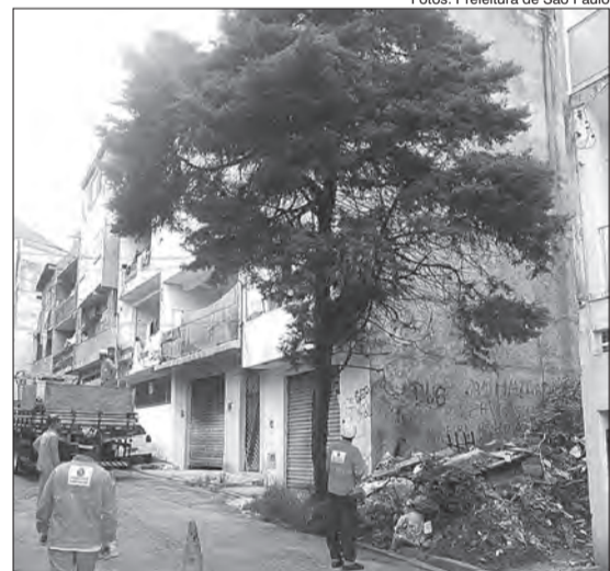
Árvore com risco de cair também foi retirada