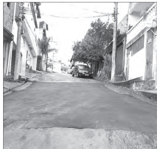
Buraco foi tapado na última terça-feira (12/1)