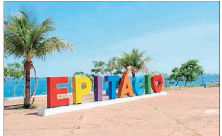
O Píer de Presidente Epitácio fica repleto de turistas na alta temporada durante o verão