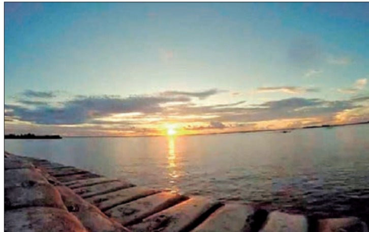
O pôr do sol na Estância de Presidente Epitácio é um dos mais bonitos da região