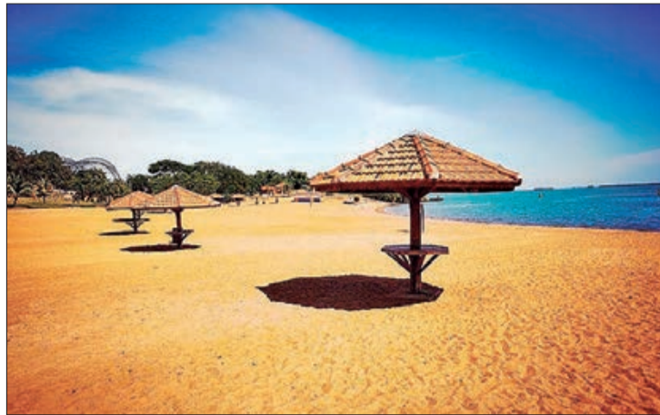
A prainha de água doce é um dos locais mais visitados na cidade e muito concorrido entre os turistas

Uma visita obrigatória é o Píer Turístico, onde ciclistas, corredores, entusiastas de caminhadas e