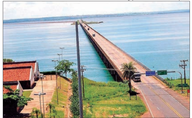
A majestosa Ponte Hélio Serejo, com cerca de 2.550 metros de extensão, liga o Estado de São Paulo ao Mato Grosso do Sul