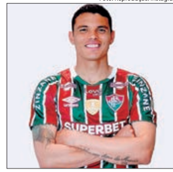
Thiago Silva está de volta ao Fluminense

1. Em cinco jogos, o São Paulo empatou um e venceu quatro, o último contra o Cobresal, em Calama, pela Libertadores. Desde a chegada do técnico Luis Zubeldía, o tricolor mostra a sua invencibilidade, nas últimas partidas. De virada, o time paulista venceu o Cobresal por 3 a 1, e se classificou com antecedência às Oitavas de Final. Luciano, Rodrigo Nestor e Calleri fizeram os gols da vitória sobre o time chileno, pela quarta rodada da fase de grupos. O São Paulo volta a campo na próxima segunda-feira, contra o Fluminense, às 20 horas, no Morumbis.