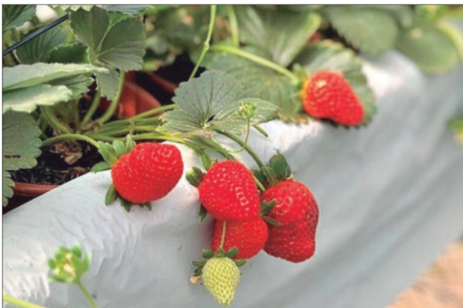
A cidade é chamada de capital nacional dos morangos e no Orquidário Takebayashi é possível conhecer mais sobre essas delícias

Explorando as trilhas da Reserva Ecológica do Vuna, admirando as orquídeas no Orquidário Takebayashi (orquideasemorangos.com.br), ou desfrutando de um passeio de teleférico sobre as montanhas, Atibaia convida você a celebrar sua diversidade e beleza. Com sua atmosfera acolhedora e uma infinidade de atividades para desfrutar, Atibaia aguarda sua visita, principalmente, para celebrar seu aniversário.