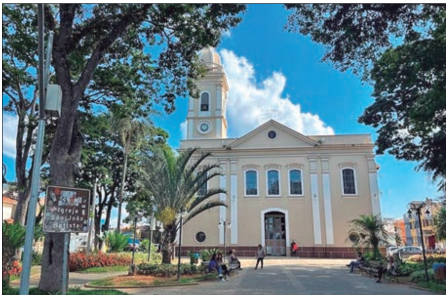
O centro de Atibaia tem muita história para contar sobre a cidade e a Igreja Matriz é uma joia da região