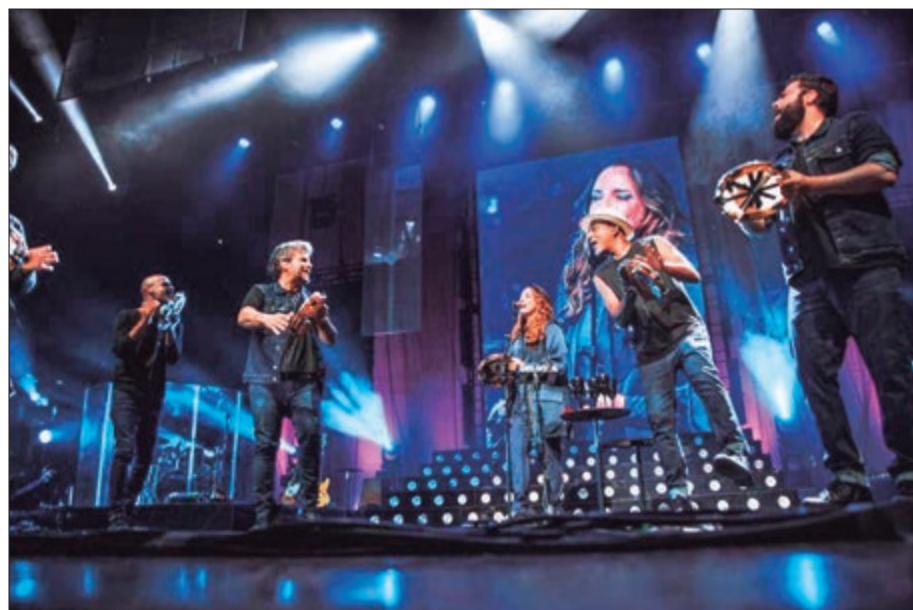
A cantora Ana Carolina, irá se apresentar no aniversário da cidade, no dia 22 de junho, junto com outras atrações como Michel Teló