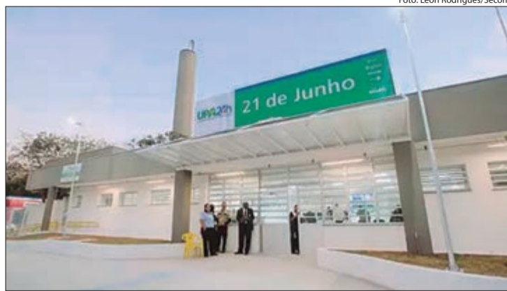
UPA 21 de Junho fica na Avenida João Paulo I, 421

Sua estrutura conta com nove consultórios médicos, quatro salas de classificação de risco, sala de odontologia, salas de medicação (adulto e infantil), salas de inalação (adulto e infantil), serviço social, sala do Núcleo de Prevenção à Violência (NPV), sala de coleta e de enfermagem. Além