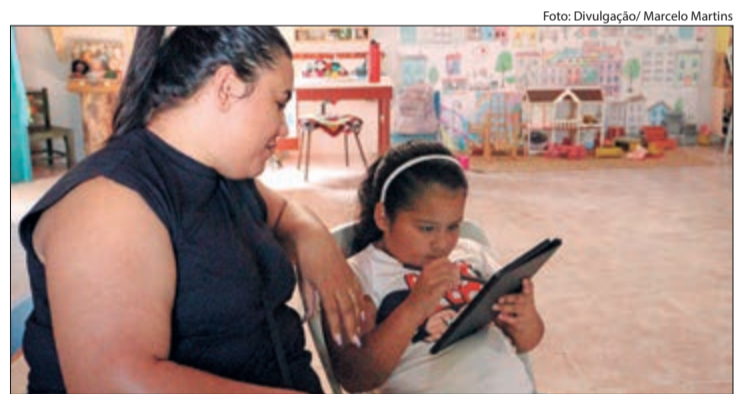
Conversar com os filhos sobre os perigos da internet e ficar atento ao seu comportamento, são fundamentais, assim como brincar

Iniciativas como o Projeto "Eu Me Amo, Eu Me Cuido" do ChildFund Brasil promovem atividades que incentivam o autocuidado e a autoproteção das crianças, contribuindo para a prevenção de violências, tanto físicas, quanto virtuais.