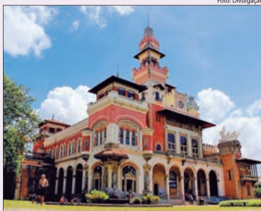
Para conhecer a programação do Museu Catavento, comprar ingresso e retirar senhas dos eventos gratuitos, basta acessar o site

As atividades ocorrem até 28 de julho, das 9 às 16 horas, no Museu Catavento, localizado na Avenida Mercúrio, Parque Dom Pedro II, sem número, no centro. A programação inclui Teatro de Sombras, Oficinas diversas e espetáculo de mágicas.