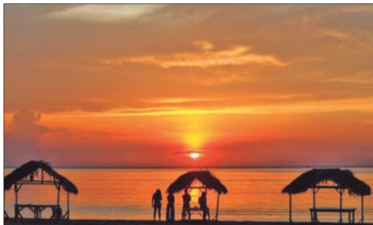
No entardecer, o pôr do sol em Alter do Chão, no Pará é um espetáculo à parte

conhecida pela culinária saborosa, com destaque para os pratos de peixe, jambu e outros ingredientes amazônicos. Para relaxar, muitos dos quiosques à beira das praias oferecem uma experiência completa: comida típica, uma bebida gelada e a tranquilidade das águas.