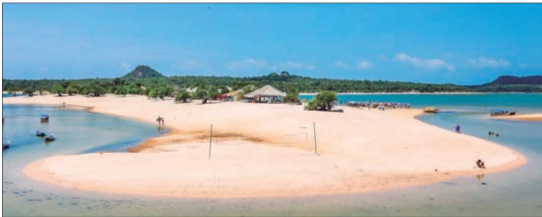
Já no “Verão Amazônico”, de agosto a dezembro, a faixa de areia aumenta e a caminhada pelas vilas ribeirinhas se torna possível