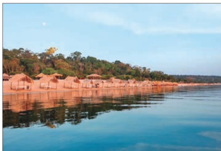
Tudo bem simples e acolhedor, as praias de água doce são um convite para o viajante que quer curtir a natureza