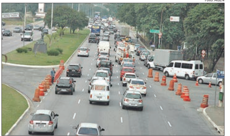
Proprietários de carros com placa final 9 devem providenciar o licenciamento até este sábado (30)

O prazo para licenciar veículos com placas de final 9 se encerra neste sábado (30). Em dezembro, termina o prazo para as placas terminadas em 0 (zero). O cronograma, definido pela Portaria nº 17/2023, estipula prazo diferente para os veículos de carga (caminhão e trator), de setembro a dezembro. Confira o calendário completo do licenciamento 2024 abaixo.