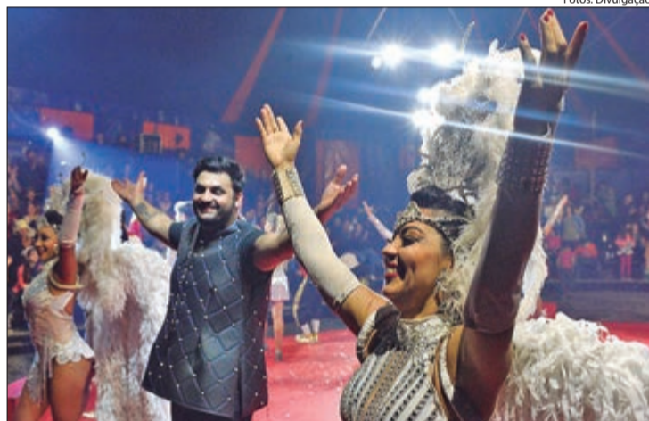
Com entrada gratuita, a temporada conta com mais de 40 apresentações e atrações especiais, unindo a magia do Natal e do Circo

Entre os dias 1º a 22 de dezembro, o Natal no Mundo do Circo promete encantar o público no Parque da Juventude, na ZN. Com entrada gratuita, a temporada conta com mais de 40 apresentações e atrações especiais que unem a magia do Natal ao universo circense. Entre os destaques está o Papai Noel Gigante, de seis metros de altura, disponível para fotos, além de uma decoração repleta de surpresas: túnel iluminado de oito metros, trenó, renas, bonecos de neve, ursos polares e uma máquina que simula neve, criando um clima natalino único.