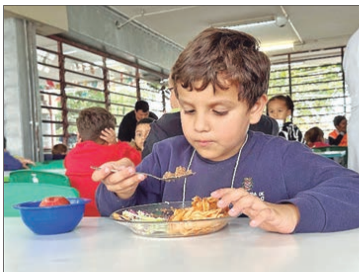
Para crianças a partir de 4 anos, serão oferecidas três refeições diárias, já nas creches polos, o número sobe para cinco refeições

educação integral, garantindo alimentação nutritiva durante o período de recesso escolar. Para crianças a partir de 4 anos, serão oferecidas três refeições diárias. Nas creches polos, o número sobe para cinco refeições.